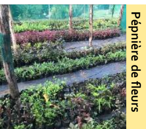
Pépinière de fleurs