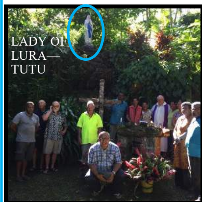
LADY OF LURA—TUTU

A tous les confrères et toutes les communautés : Saintes et Joyeuses Pâques ! A tous nos bienfaiteurs et amis : Bonne Semaine Sainte et Pâques d'allégresse !