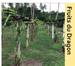
Fruits du Dragon