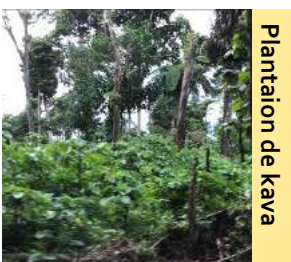
Plantation de kava