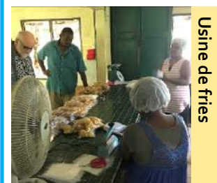
Usine de frites