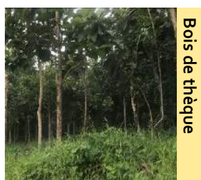
Bois de thé