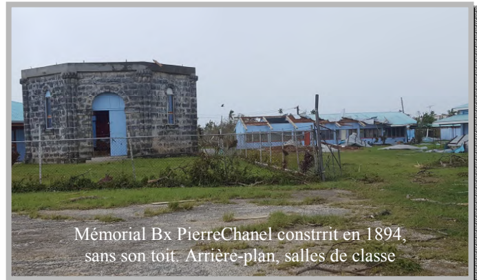
Mémorial Bx PierreChanel construit en 1894, sans son toit. Arrière-plan, salles de classe