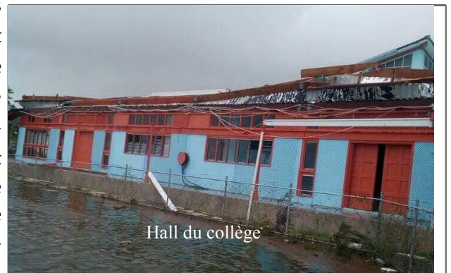
Hall du collège