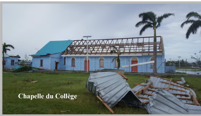
Chapelle du Collège