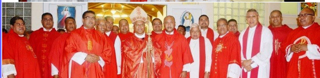
Lutoviko avec le cardinal et des prêtres, diocésains et maristes